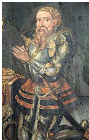
Erik Emune – malet ca.1575